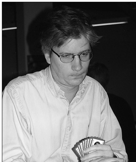
"Joppes" inspiration ger 10 imp.

Kontraktet hette 3 sang och budgivningen dit var ostörd. Väst startade med klöverdam som PO tog med esset för att fortsätta med spaderkung från handen. Väst tog för esset och fortsatte med klöverknekt som PO vann med kungen medan