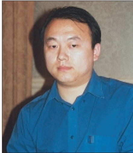
Chuan Cheng Ju bjuder hårt.

Matchen mot Kina visades i raman och böljade fram och åter. Kineserna bjöd stenhårt på flera