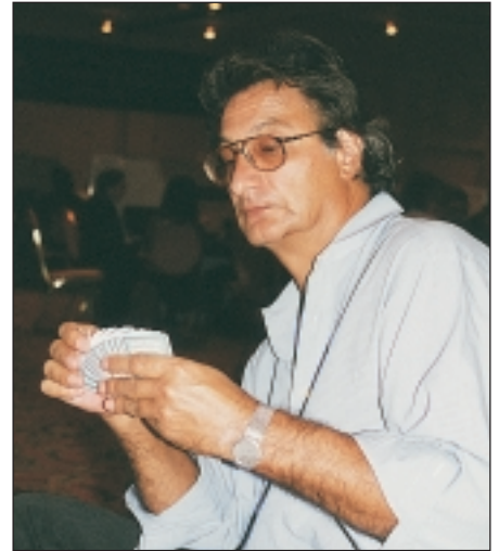
Zia tänker mer på mat än bridge.