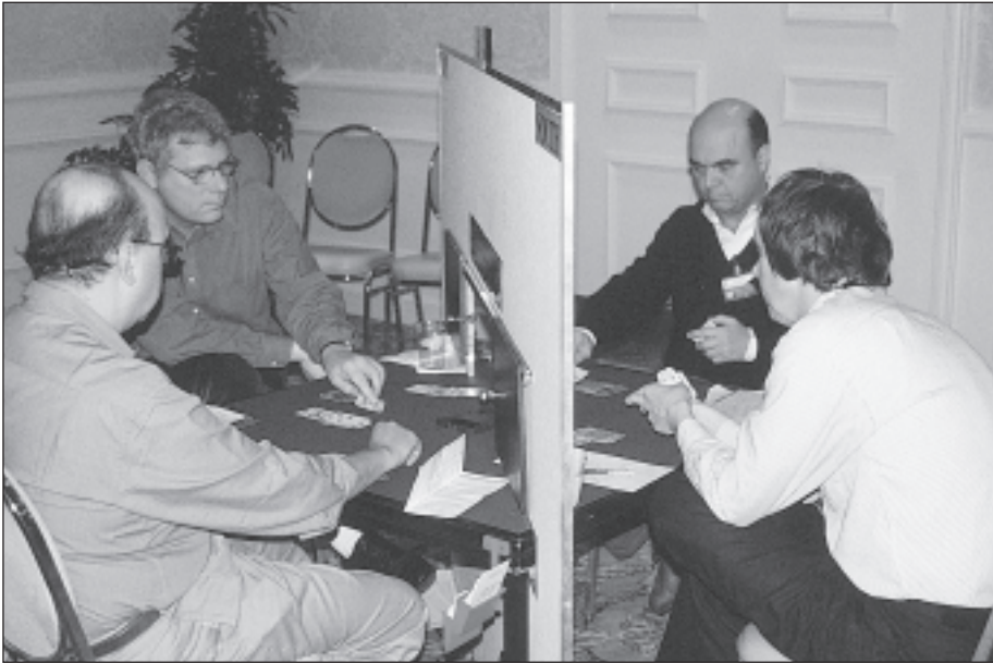
Fallenius och Nilsländ agerar målvakt mot Branco-Chagas och plockar imp efter imp. Men efter den blytunga starten räcker inte tempot.