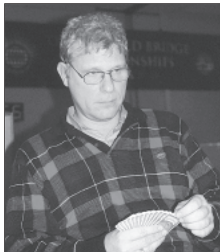
Fallenius – bjuder utgång.