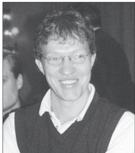
Fredin – vinnare i längden.