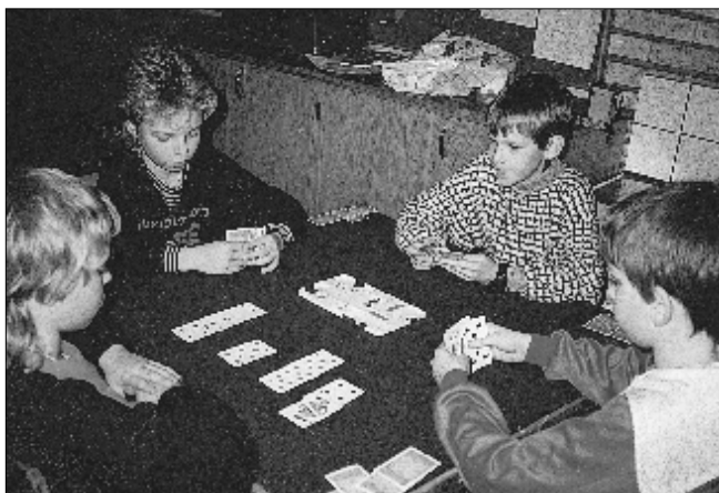
En sport och fritidssysselsättning för såväl unga som gamla - svensk bridge siktar mot framtiden.