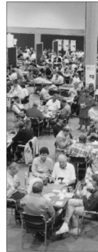
SM-veckan i Skövde i Blå Hallen på Billinge-nus har varit en succé sedan starten 1995.

negativ till förslaget. Men nu blev det alltså verklighet och de första åren har blivit mycket lyckade.