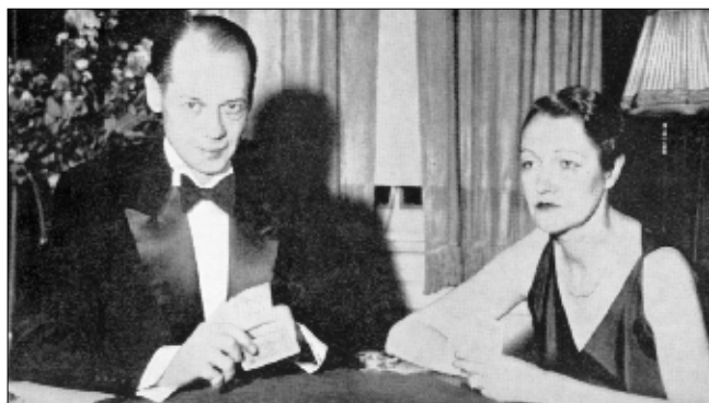
Världsmästarpar i Budapest 1937, Ely och Josephine Culbertson.

DET VAR FRÄMST amerikanerna som systematiserade briden och vidareutvecklade reglerna och metoderna. En förgrundsfigur i det sammanhanget var Harold Vanderbilt som under 1920-talet dels konstruerade ett för den tiden