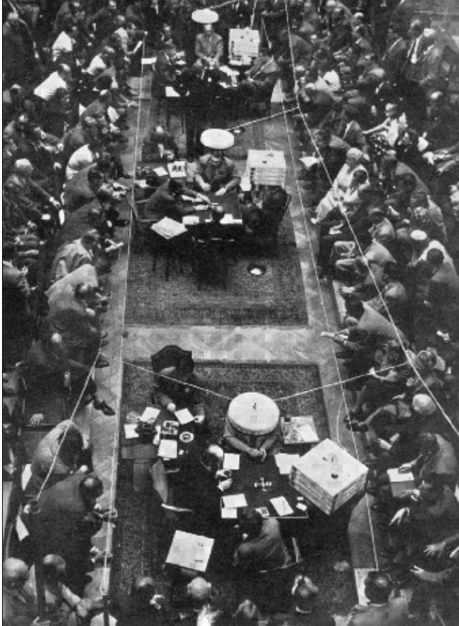
Huvudarenan vid EM i Stockholms 1956. Publikintresset var stort och entréavgifterna uppgick till 17.000 kr, men arrangemanget kostade betydligt mer.