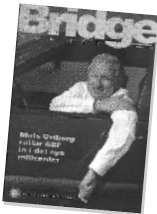
Tidningen Svensk Bridge betyder mycket för information och sammanhållning inom bridgen.

SBF stod därför ganska väl rustade för att möta 70-talet, då en stor utmaning väntade redan 1970 då VM skulle arrangeras i Stockholm.